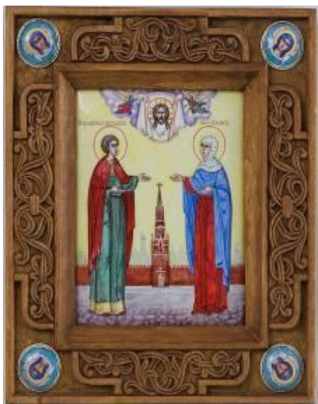
икона Петра и Февронии Муромских, резная рама

Икона изображает святых муромских чудотворцев Петра и Февронию